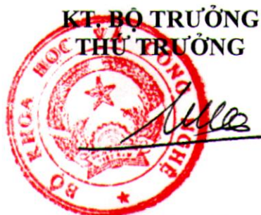
Phạm Công Tạc